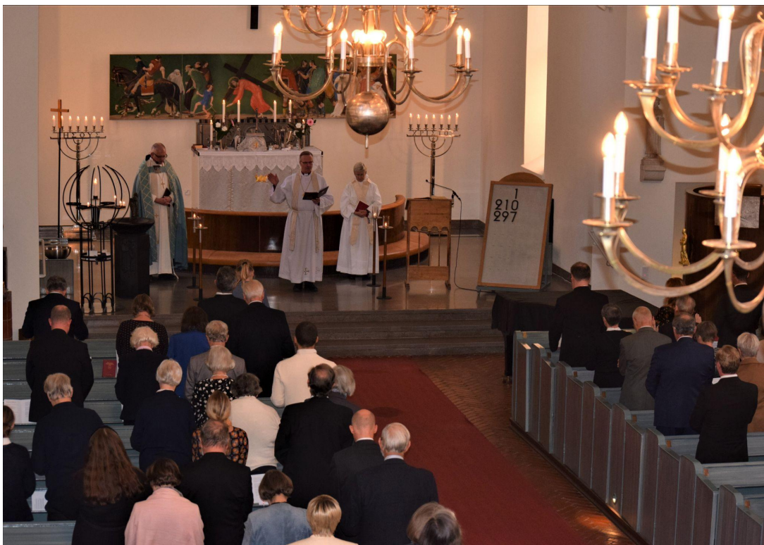
Många på plats för att fira OP:s 100-årsjubileum.