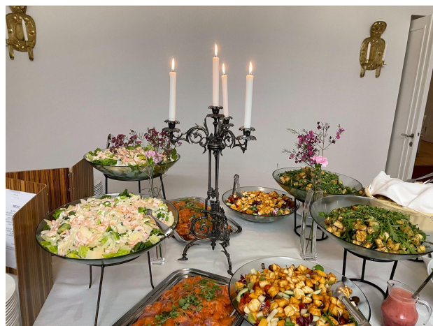
Jubileumsmiddagens välsmakande förrätt.