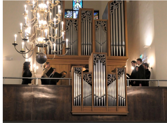
Olaus Petri-kören.