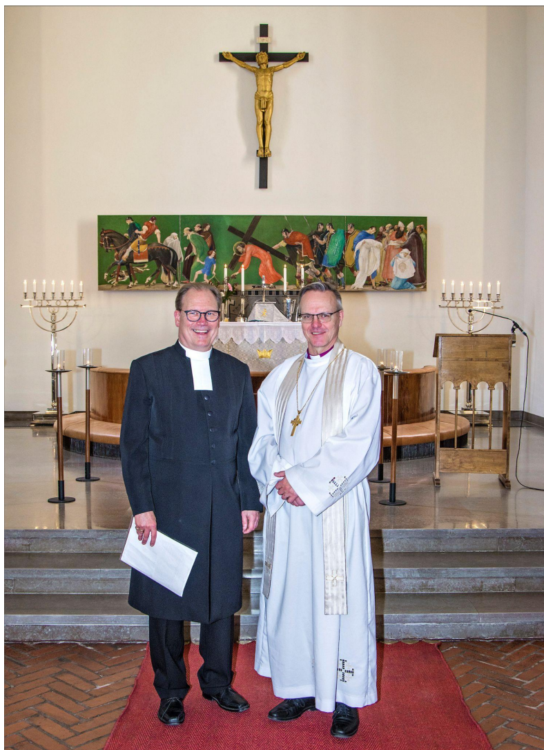
Kyrkoherden tillsammans med ärkebiskopen.