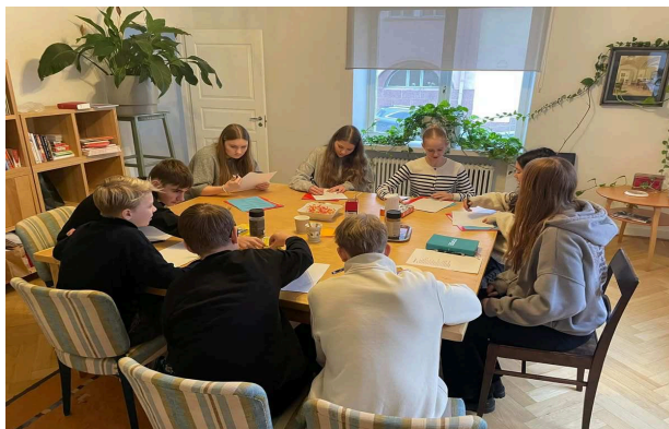
Bild från ett lektionspass om Gudsbilder i prästgården, där några av årets konfirmander är samlade. Konfirmanderna åker i början på juni på en veckas "skribaläger" till Stockholm. Mer info om nästa års konfirmationsundervisning kommer i höstens OP-blad.